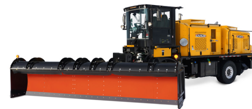
FP18 | FP20 | FP22