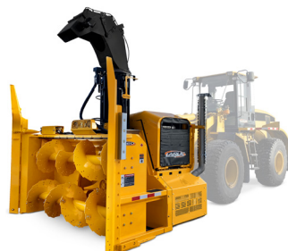
D30 | D40 | D50 | D60