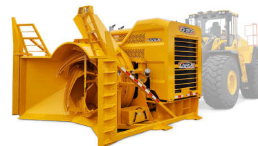
D87 | D97