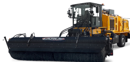
FB18 | FB20 | FB22