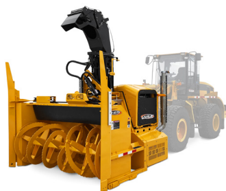
D25 | D35 | D45 | D55 | D65